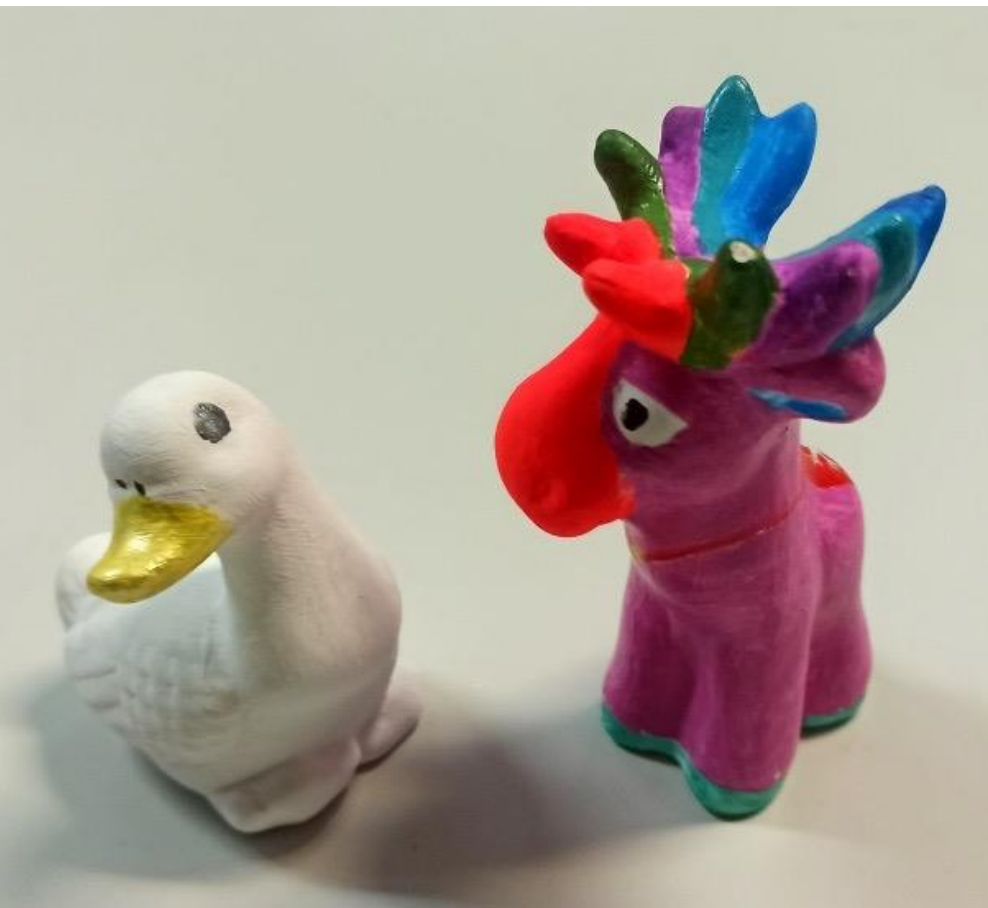
Проектные работы роспись по керамике