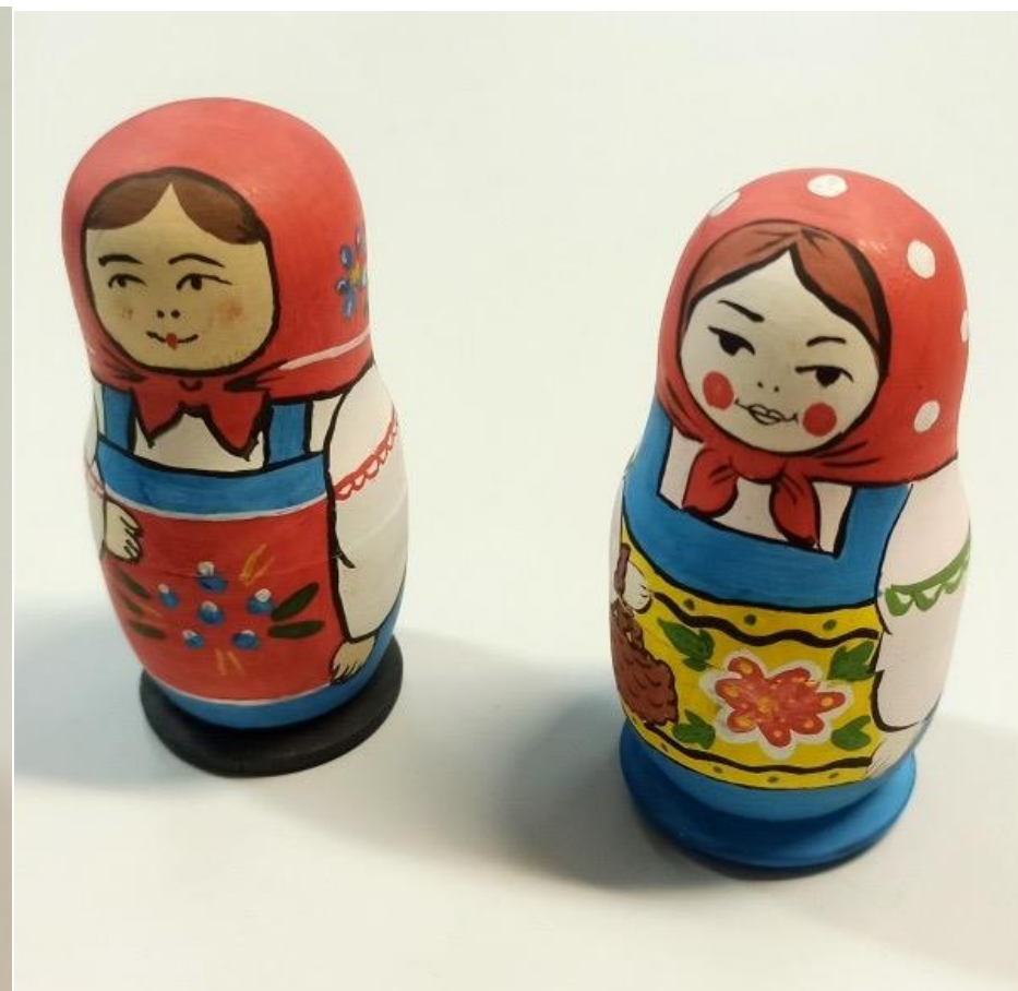
Проектные работы роспись по дереву