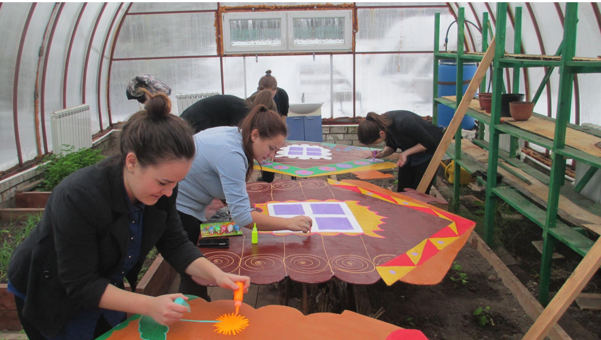
Проект «Избушки по временам года»