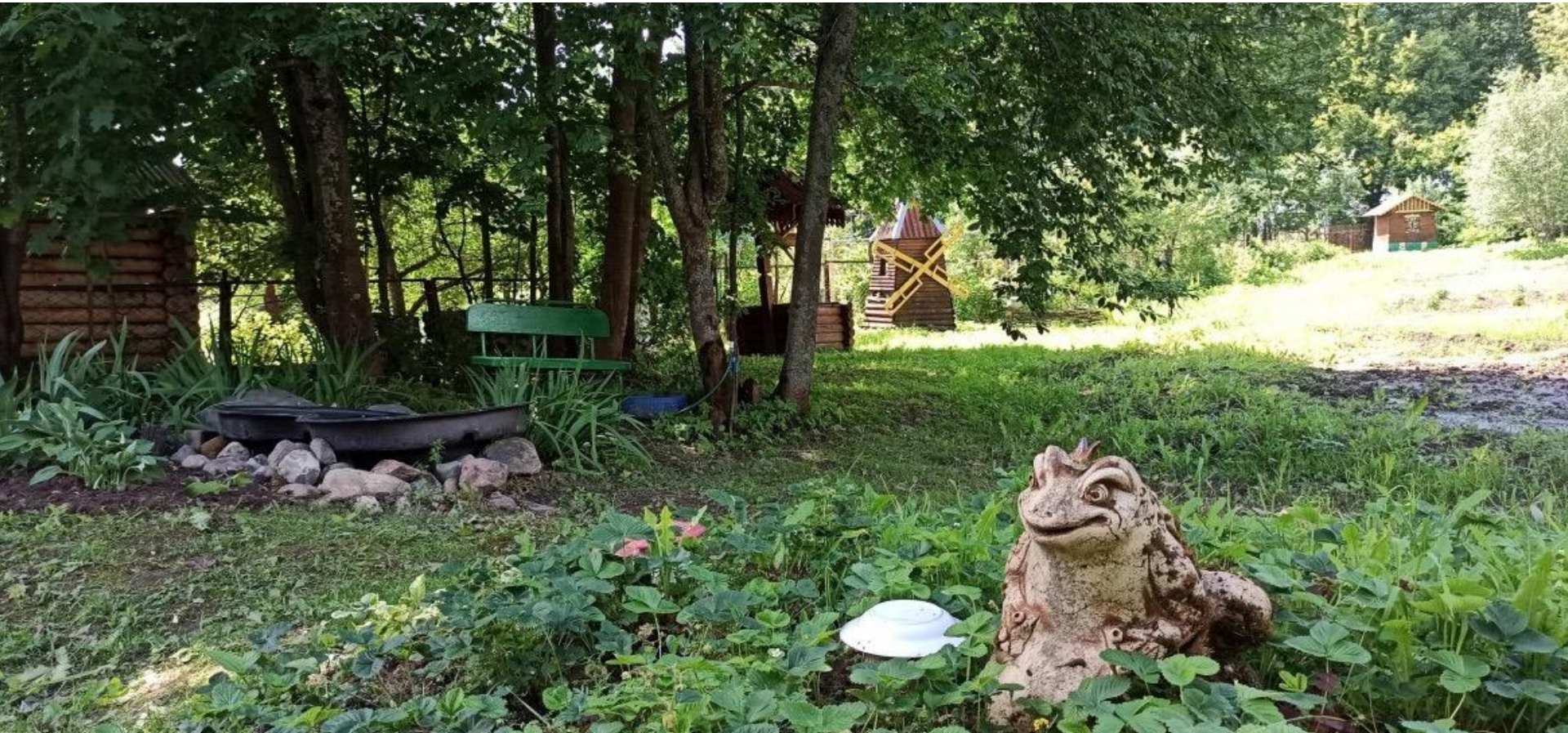
Проект «Зона отдыха на пришкольной территории»