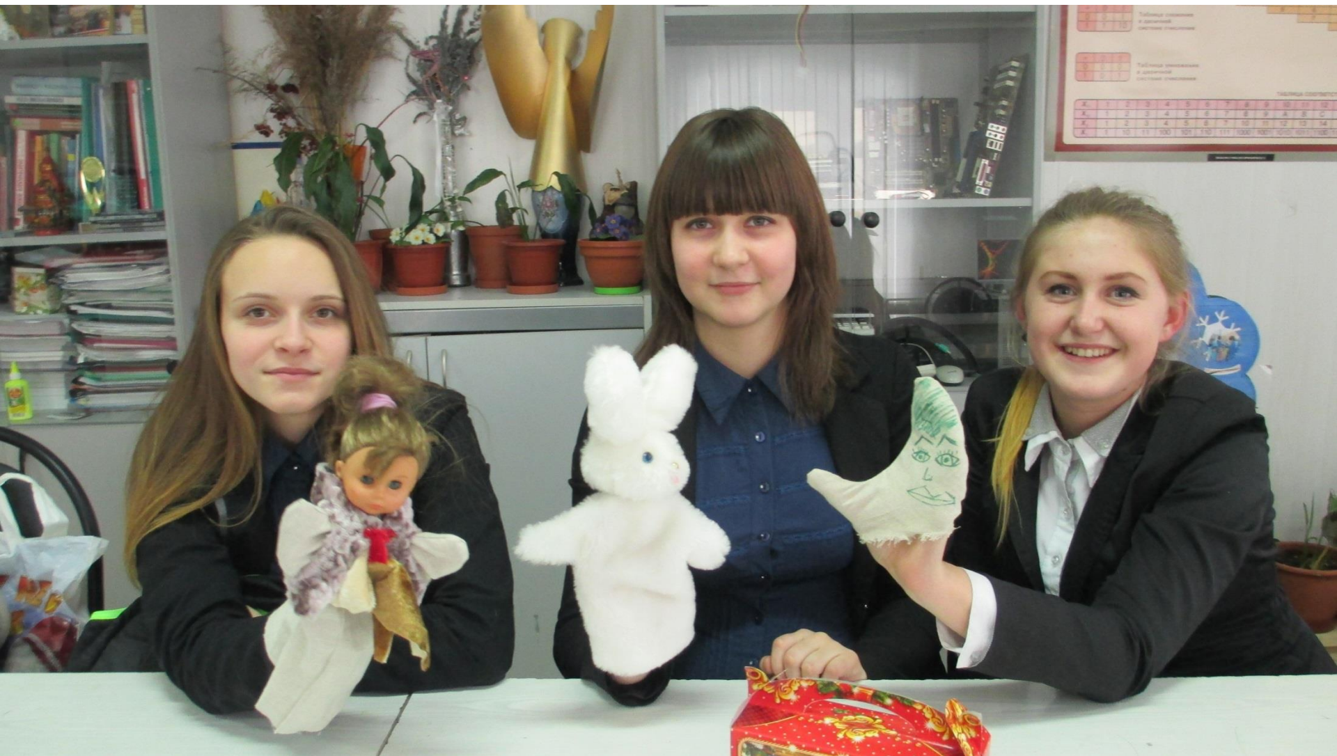
Проект «Кукольный театр»