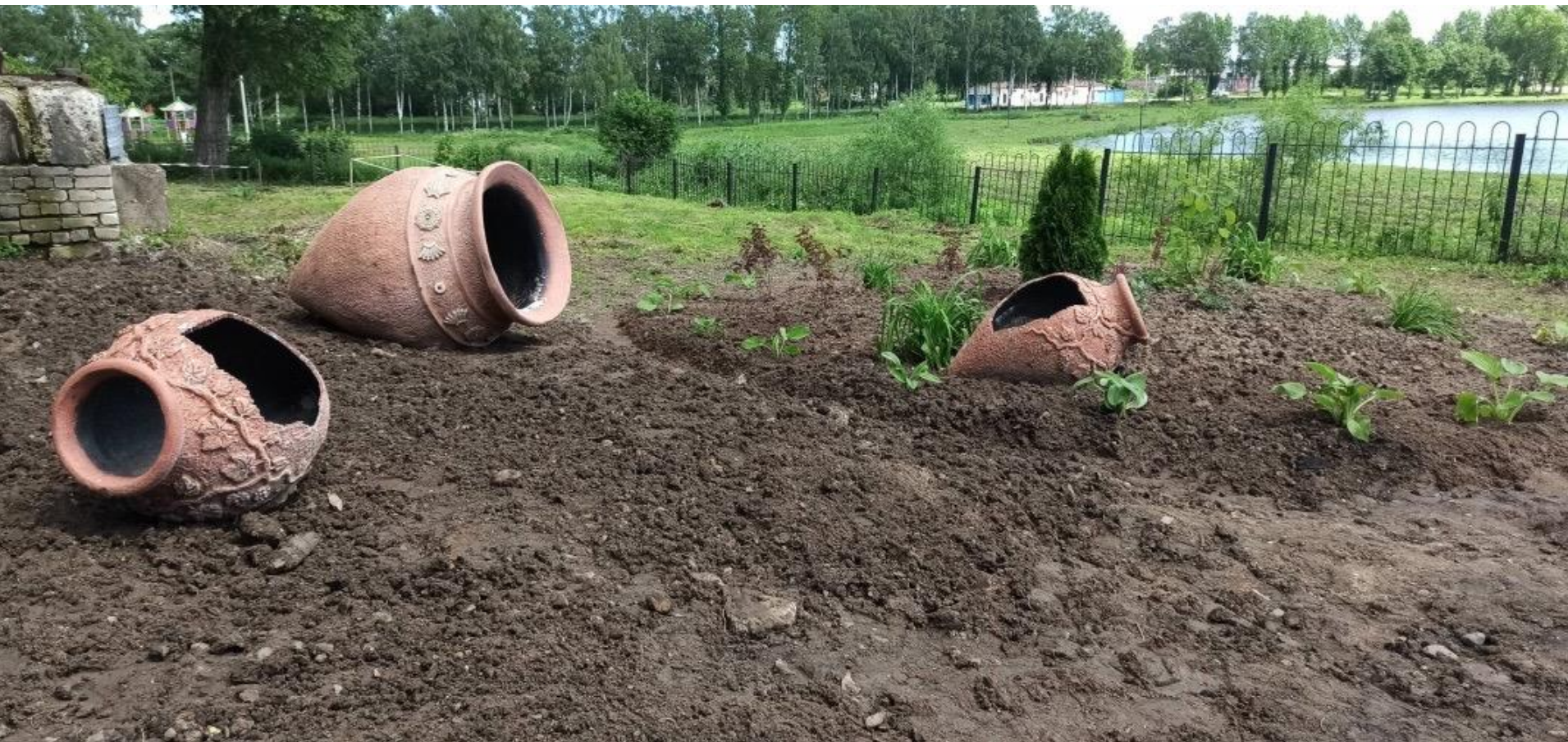
Проект «Оформление клумбы у гончарной мастерской школы»