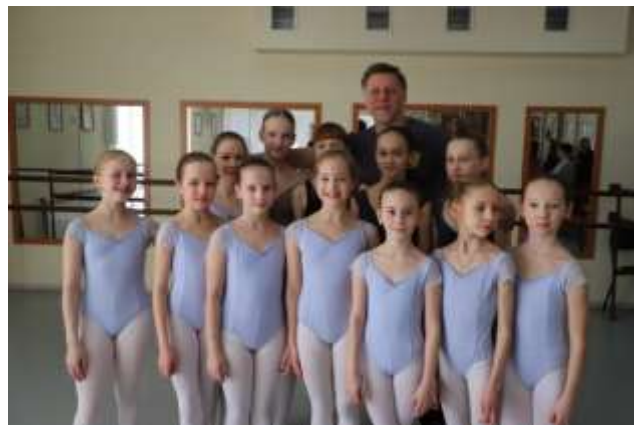
Гедиминас Таранда, артист балета, создатель и художественный руководитель «Имперский русский балет», город Москва