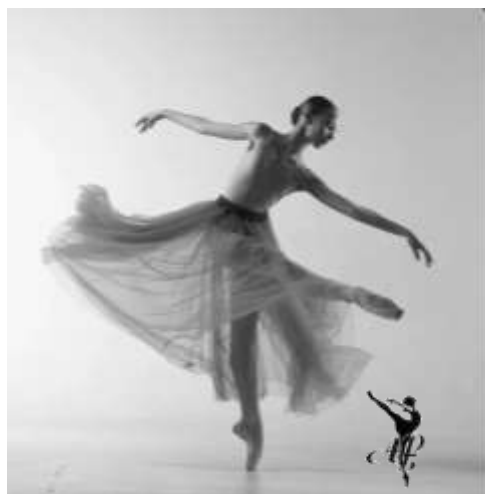
АКАДЕМИЯ РУССКОГО БАЛЕТА имени А.Я.ВАГАНОВОЙ