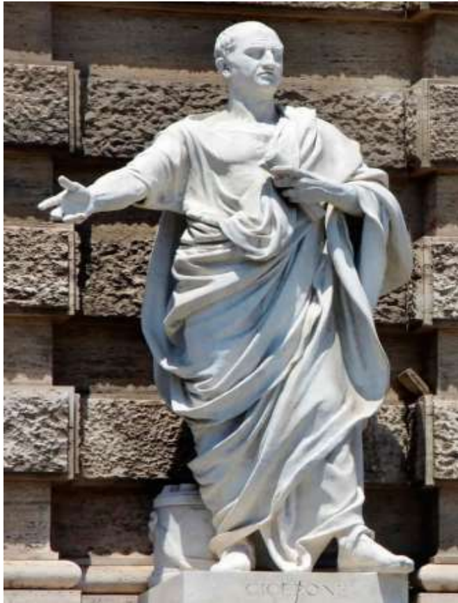
Марк Туллий Цицерон

«Найдется ли такой человек, на которого не произвела бы впечатления древность, засвидетельствованная и удостоверенная столькими славнейшими памятниками?»