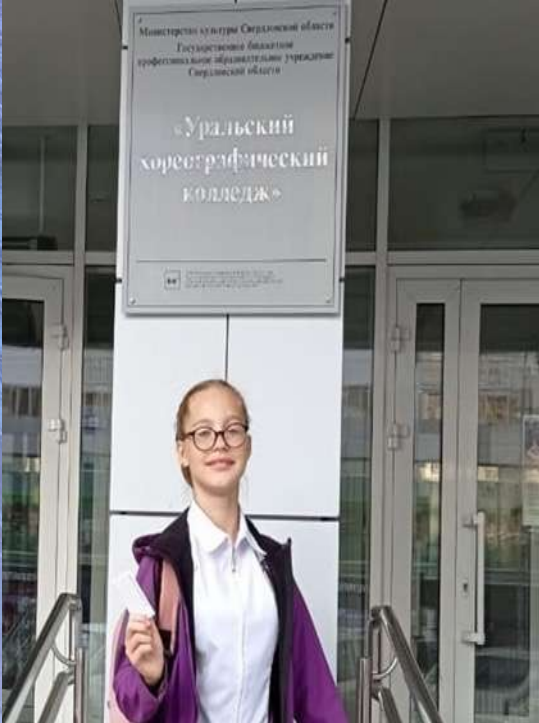
«Уральский хореографический колледж» (г. Екатеринбург)