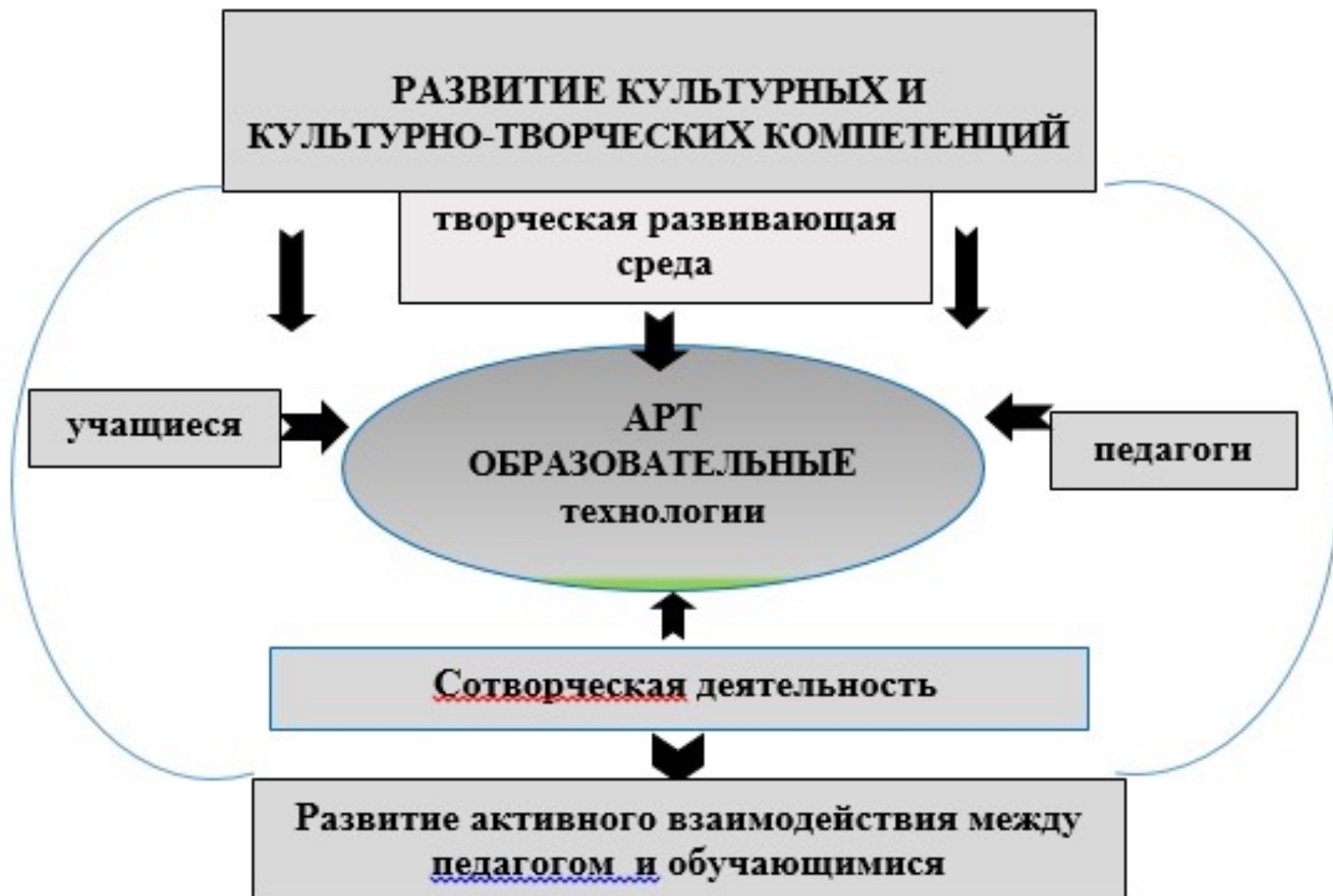
Рисунок 1. Схема модели формирования культурных и культурно-творческих компетенций у обучающихся